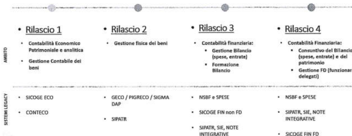
Figura 1 – Progressivi rilasci previsti nell'ambito del Programma InIt

Attualmente è previsto un piano di quattro progressivi rilasci come illustrato nella Figura 1. Ogni rilascio è focalizzato su uno o più ambiti contabili e impatta sulle funzionalità degli attuali sistemi resi disponibili dalla RGS (detti sistemi legacy ) che verranno progressivamente assorbiti dal nuovo sistema InIt.